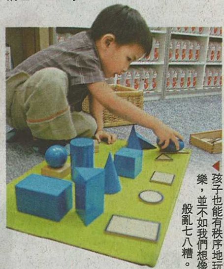
孩子也能有秩序地玩樂，並不如我們想像般亂七八糟。

0 至 3 歲孩子的學習模式；如何為孩子在家中推行蒙特梭利教育法；為幼兒設計家居學習環境；日常生活及語言教育的重要性。 日期：7 月 30 日 10am 至 1pm 查詢：3589 6366 網址：infinitychildren.com