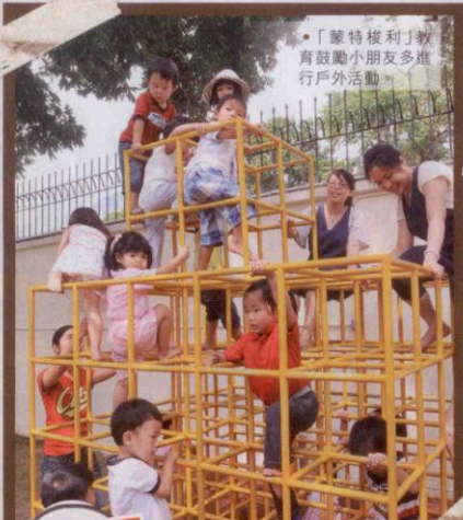
●「蒙特梭利」教育鼓勵小朋友多進行戶外活動。

玩具太多 太多玩具會影響小朋友的專注力，亦令他們不懂分先後次序，小朋友視線範圍內的玩具，八至十件已足夠。色彩柔和的玩具，可引發他們思考用甚麼動作來玩。