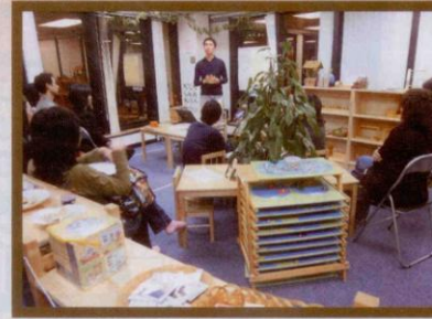
●家長送孩子入學前，須先上課學做「蒙媽」、「蒙爸」。